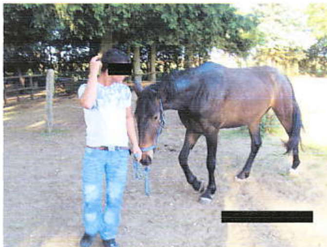
Bild zeigt das ges. Pferd