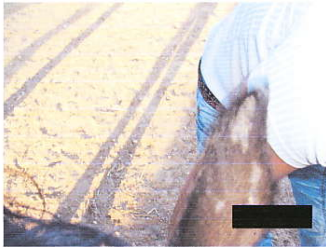
Bild zeigt die Ohren