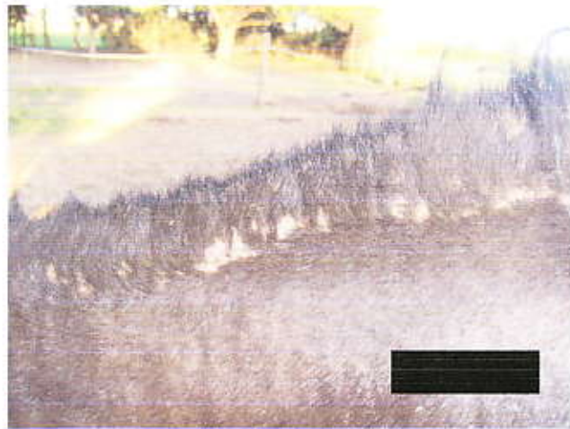
Bild zeigt die Mähne