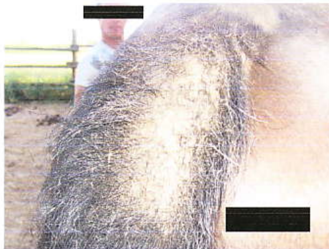
Bild zeigt den Schweifansatz