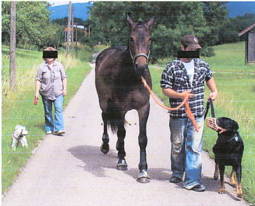
Bild zeigt den ersten Spaziergang

Dies war ein extremer Fortschritt. Sie orientierte sich dabei stark an ihrem vertrauten Besitzer, war brav und neugierig.