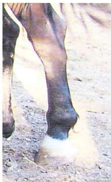
Sallys Bein damals

Mit Erfolg, das Bein wurde langsam aber sicher immer normaler.