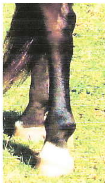
Sallys Bein heute